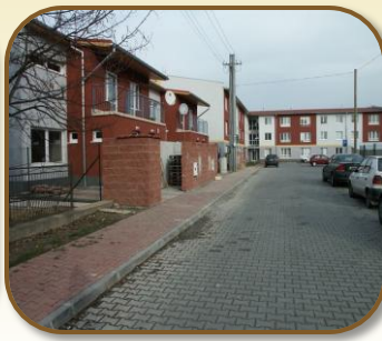
א קאמפלעקס אויף א ביה"ח

זייט גישט קיין צועק אלשעבר! אין די ביה"ח האט מען ליידער אסאך פארשפילט און ס'איז פארשוועכט געווארן דער מקום קדוש.