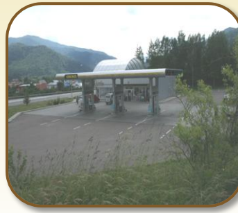
א גאז סטאנציע אויף א ביה"ח